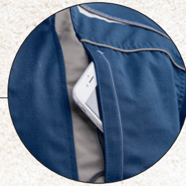
2 innenliegende Brusttaschen mit Reißverschluss