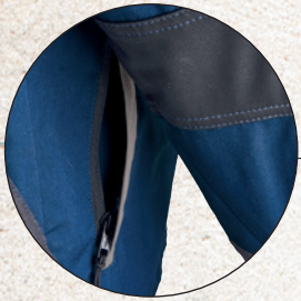
2 große Eingriffstaschen mit Reißverschluss