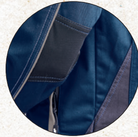
Optimale Bewegungsfreiheit durch elastischen Einsatz im Ellbogenbereich